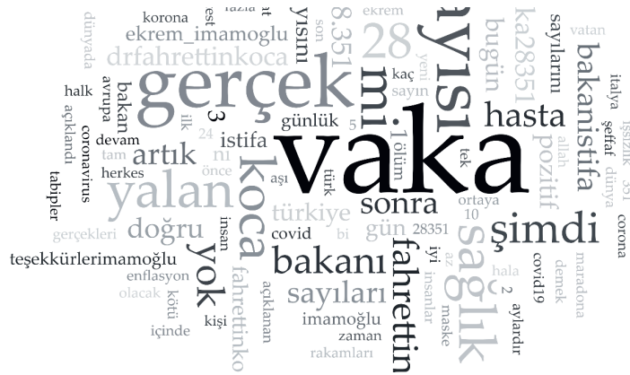
Şekil 3. Kelime bulutu

Şekil 3, dolgu sözcükleri çıkarıldıktan sonra geriye kalan kelimelerin sıklıklarına göre büyükten küçüğe sıralandığı kelime bulutunu göstermektedir. Tüm tweetler içinde en sık tekrarlayan 5 kelime; vaka (n=2099), gerçek (n=1020), sayısı (n=879), yalan (n=625) ve sağlıktır (n=623).